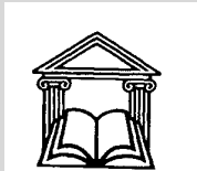
Ordine Avvocati Pescara